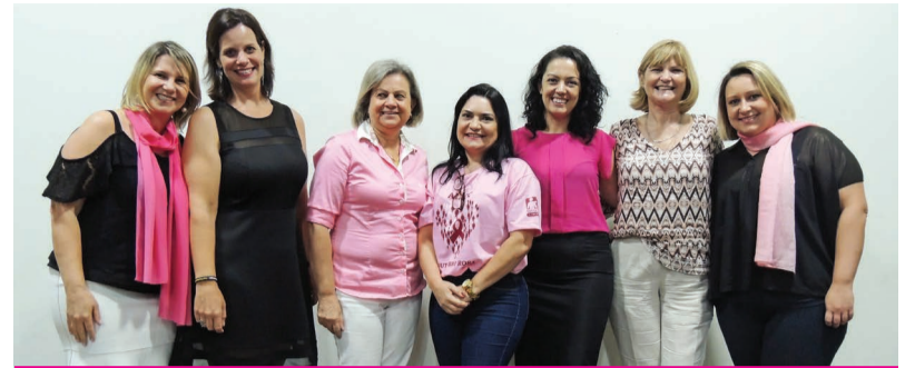
Integrantes do Conselho da Mulher Empreendedora - CME